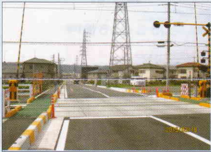
川寺・笠縫地区の新踏切完成