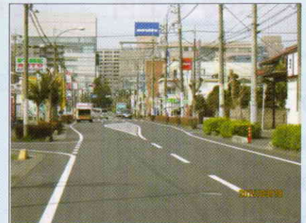
東飯能駅東口通りの舗装打ち換え