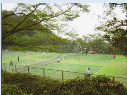
美杉台のテニスコートにトイレ設置