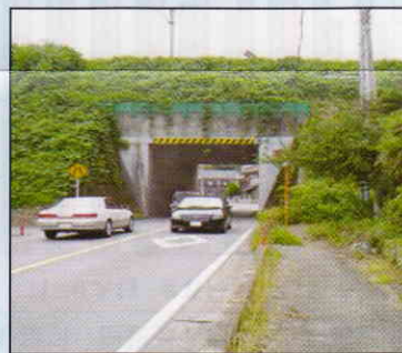
阿須ガードの拡幅