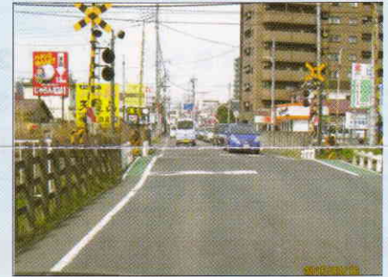
柳原地区の踏切拡幅完成間近