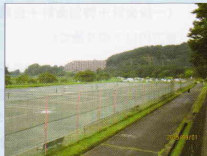
阿須と岩沢の運動公園にトイレ設置