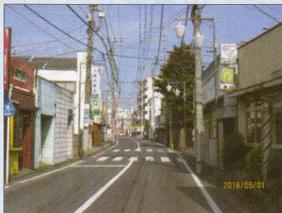
久下・六道線舗装の打ち換え