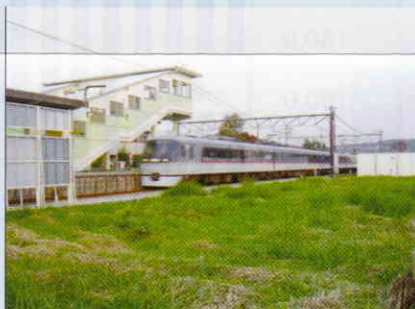
元加治駅南口の開設