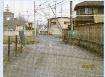
笠縫区画整理道路の整備