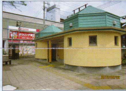
飯能駅南口と多峯主山に観光トイレ