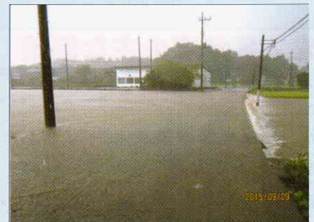
南小睦川の治水、改修工事の促進